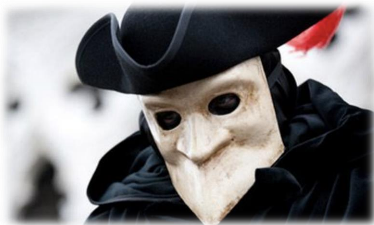
- Le Grand Maître de la Loge Davel -

Participants : de 16 à 99 ans. Vos invités n'ont rien à préparer, ils n'ont besoin que de leur téléphone portable avec la batterie chargée . Lausanne étant une ville pavée, des chaussures adaptées sont conseillées. Parapluie, idéalement pélerine, sont parfois nécessaires, puisque la partie a lieu par tous les temps. Nul besoin d'être sportif, simplement pouvoir faire une balade de plusieurs heures en ville. Les participants peuvent s'arrêter librement pour boire un verre ou se restaurer dans l'un des nombreux établissements de la ville.